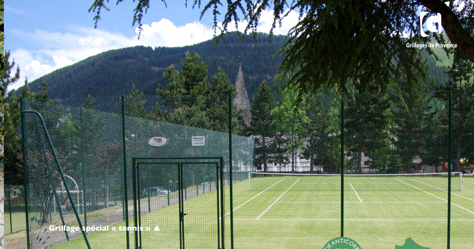
Grillage spécial « tennis » ▲