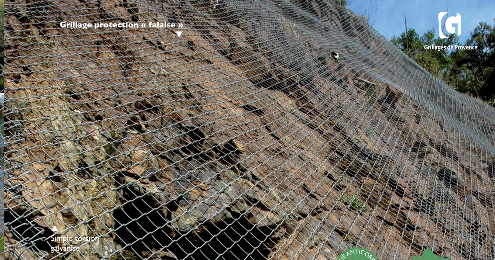
Simple torsion galvanisé