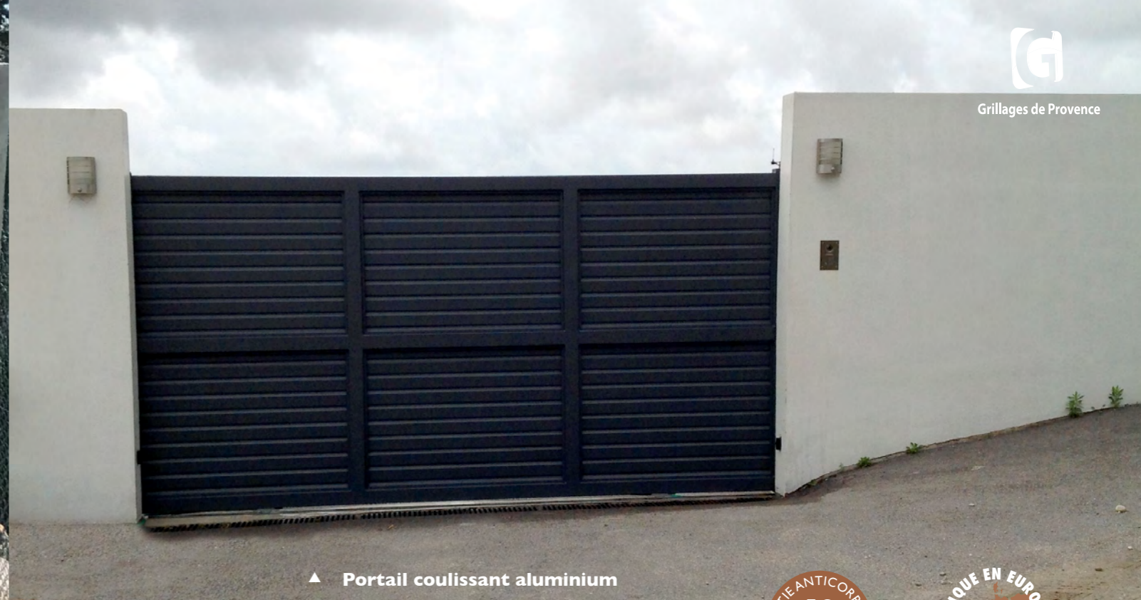
▲ Portail coulissant aluminium