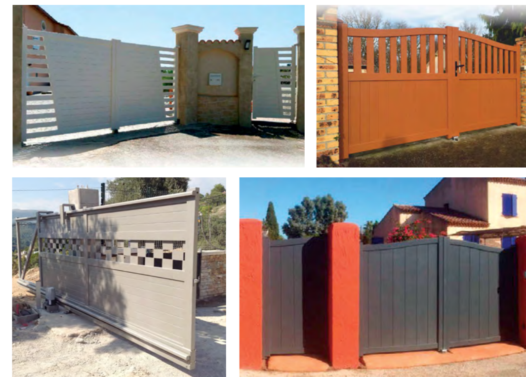
Exemple de réalisations