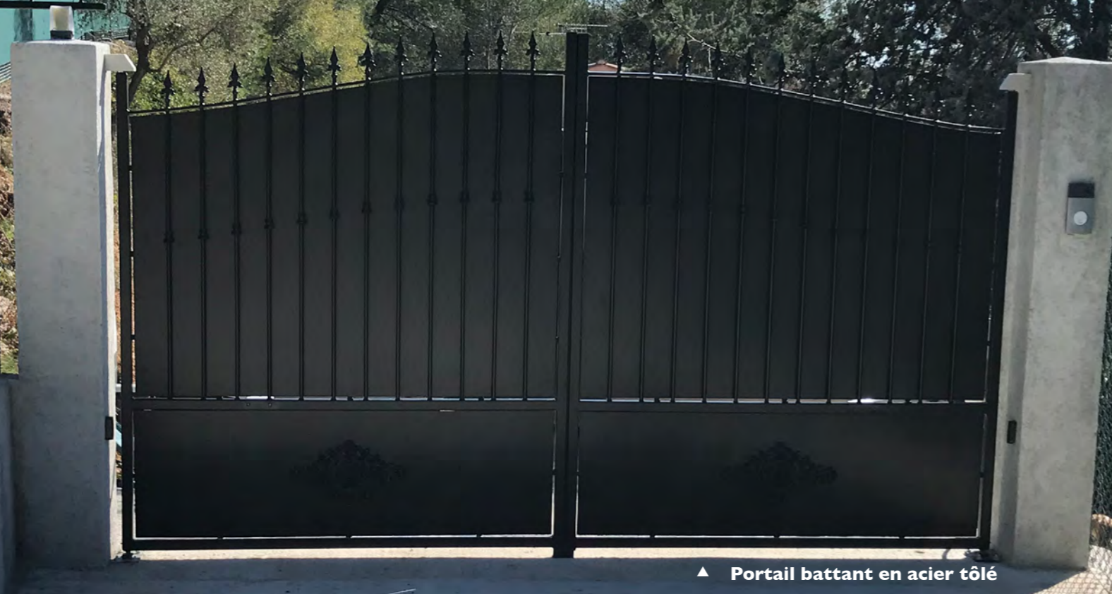
▲ Portail battant en acier tôle