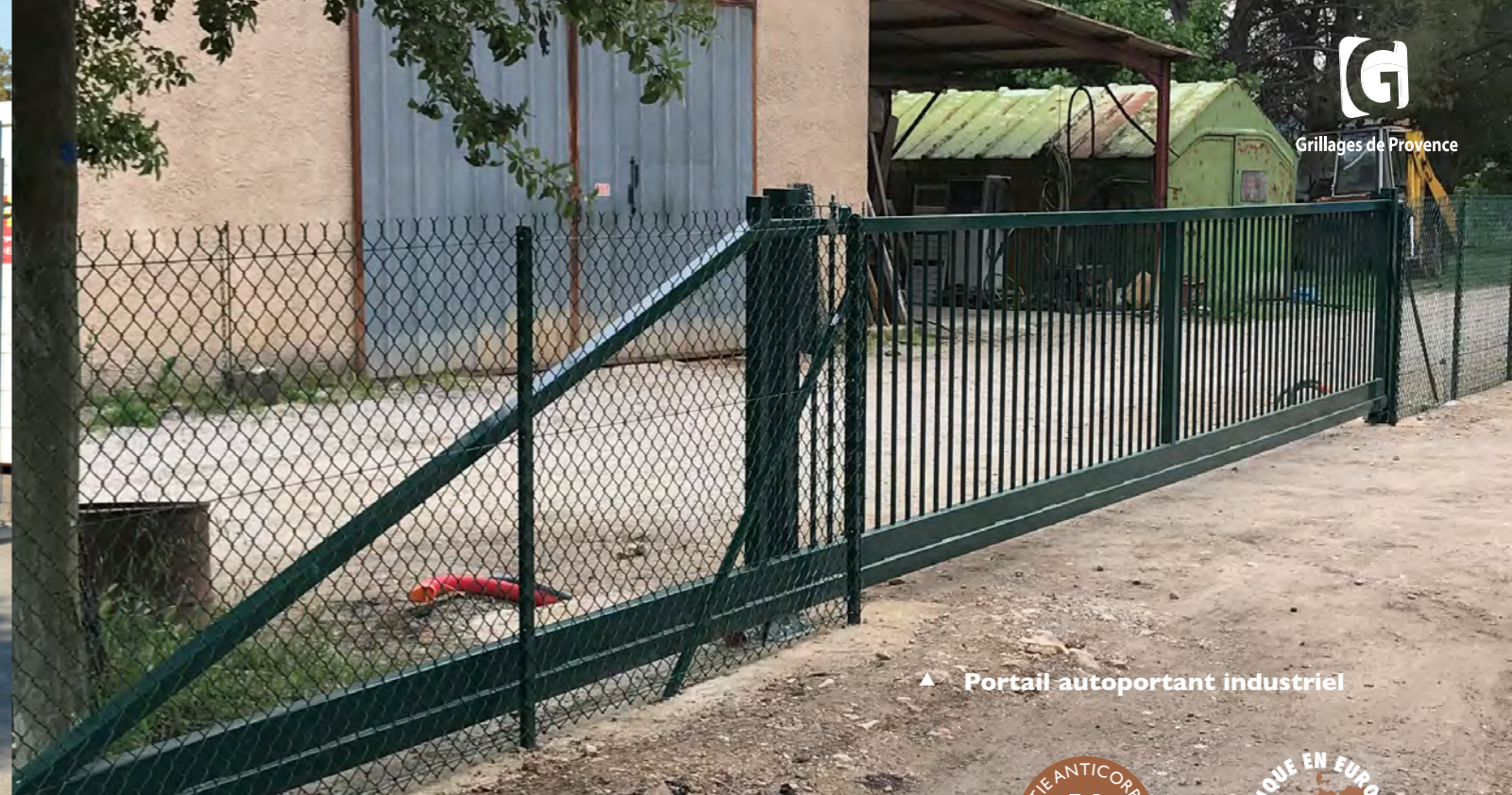
▲ Portail autoportant industriel