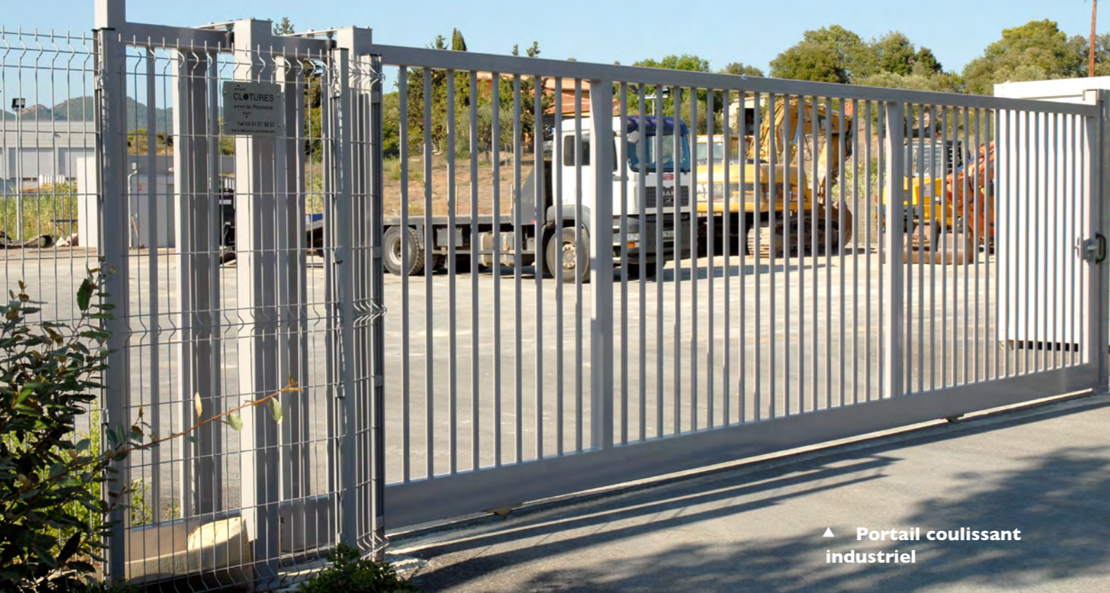
▲ Portail coulissant industriel