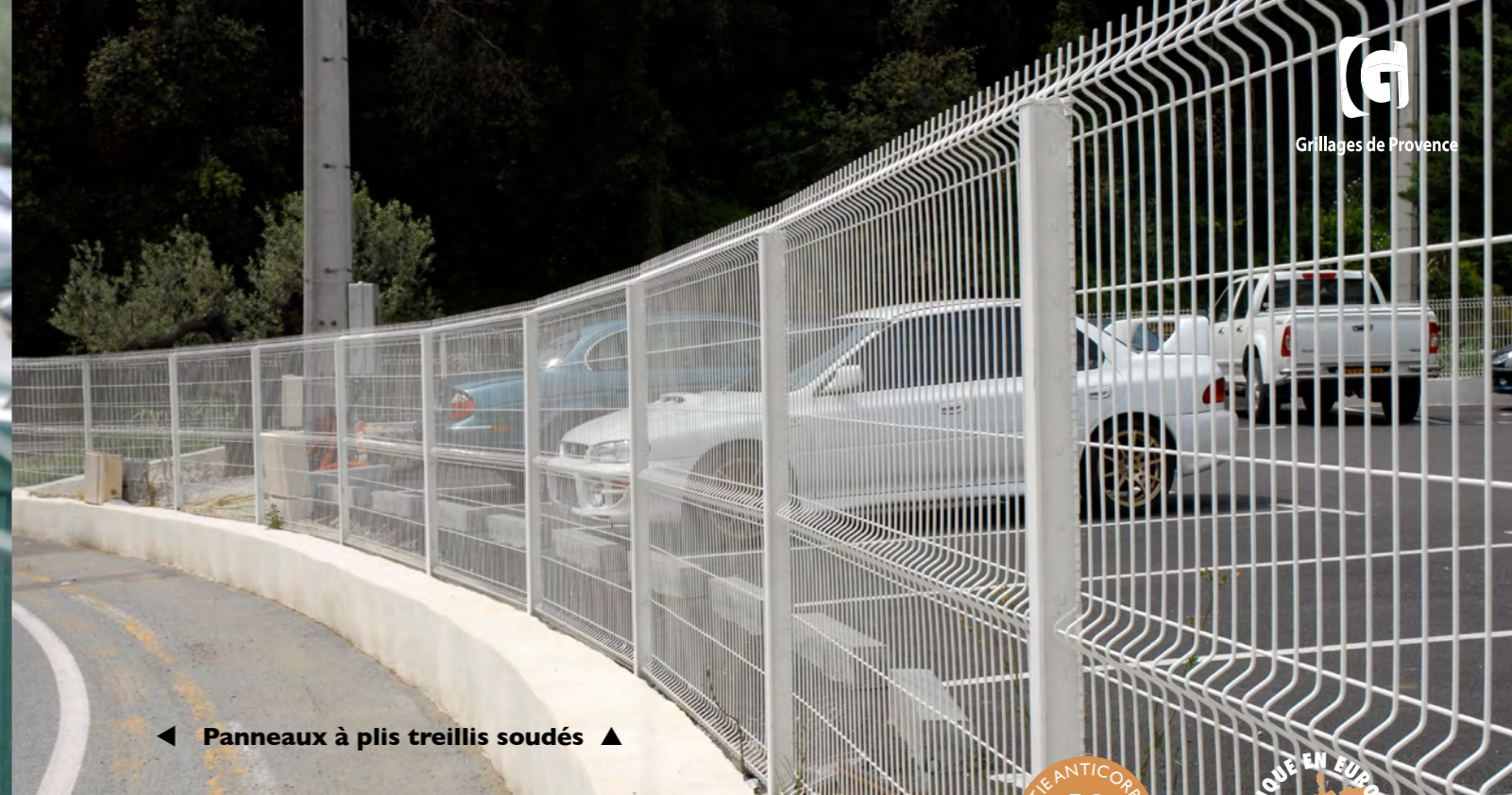
◀ Panneaux à plis treillis soudés ▶