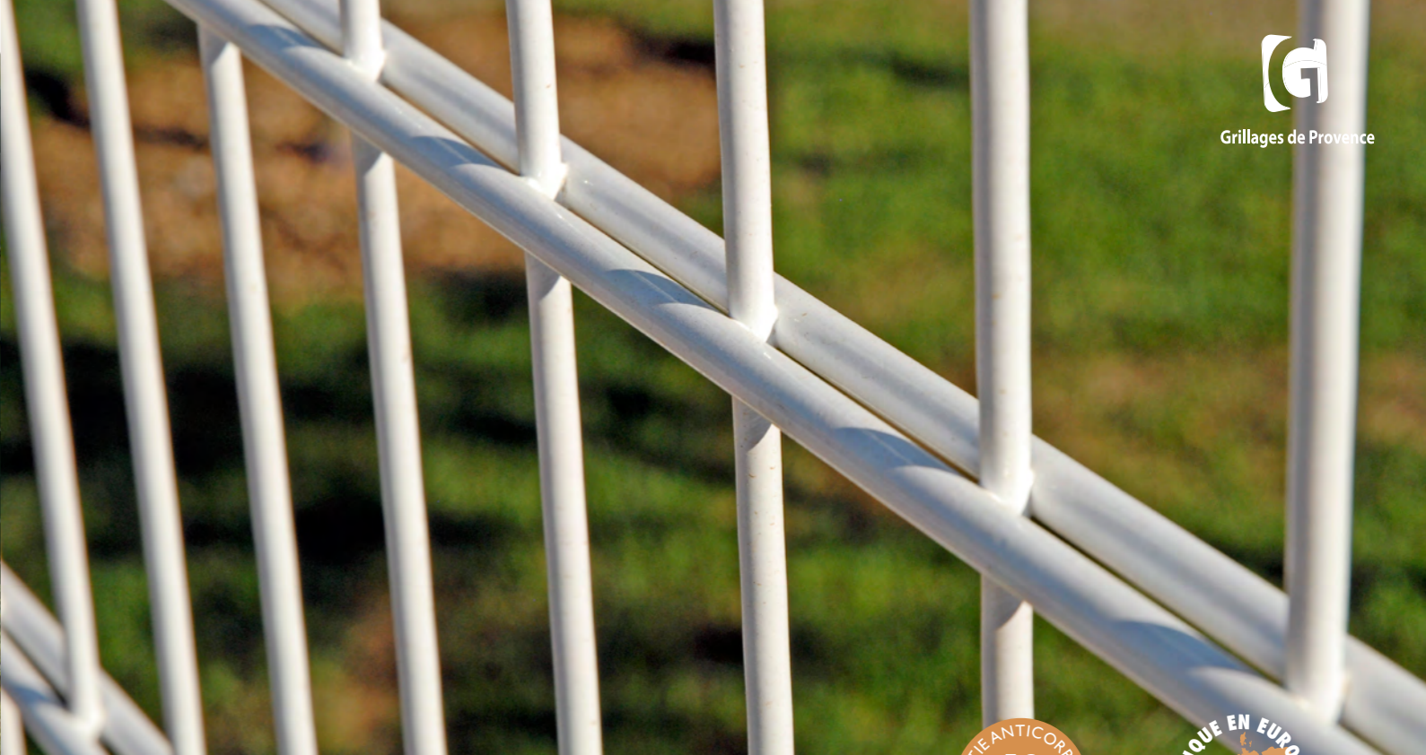
▲ Panneaux double fil treillis soudés ▶