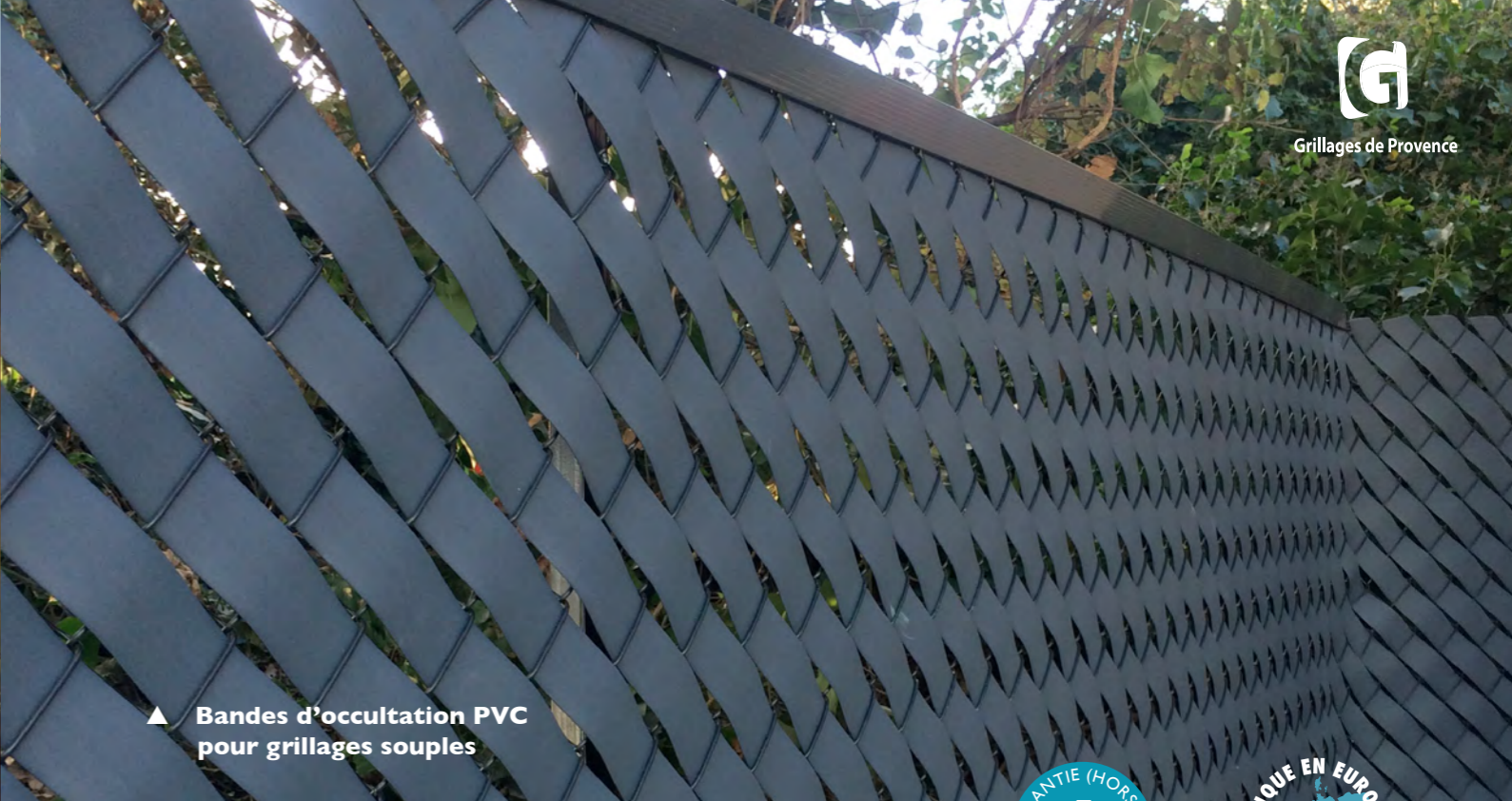
▲ Bandes d'occultation PVC pour grillages souples