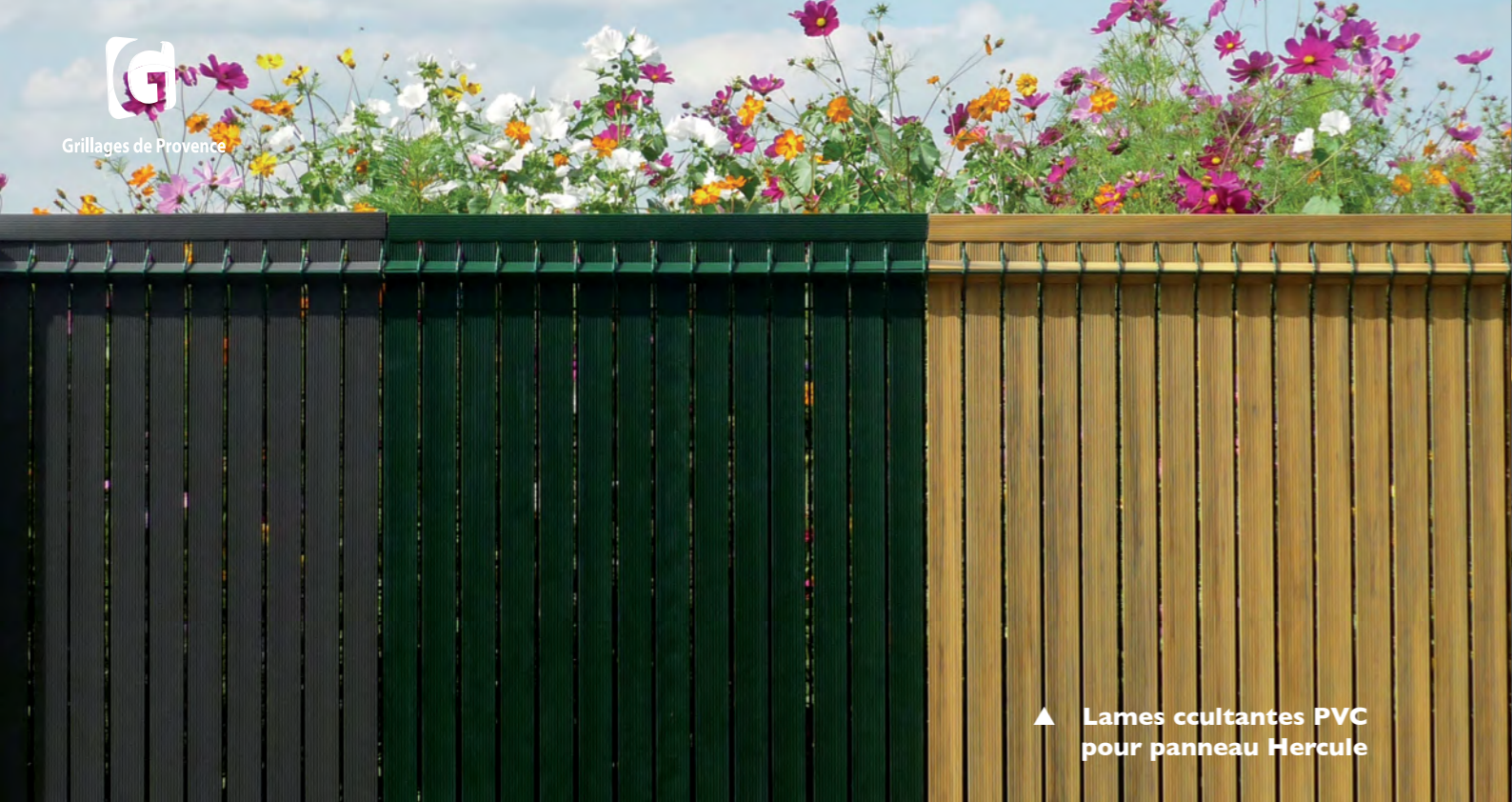
▲ Lames occultantes PVC pour panneau Hercule