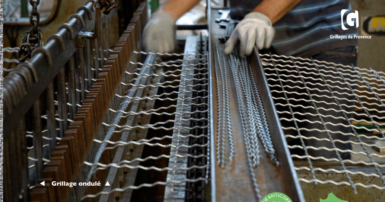
◀ Grillage ondulé ▶