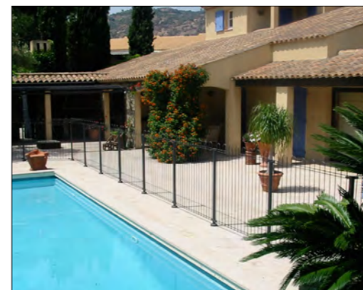
Réalisation avec poteaux sur platines