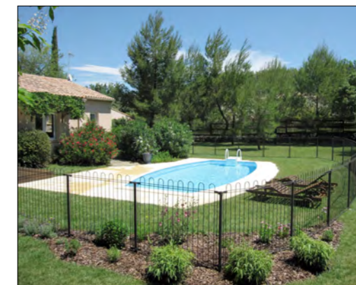
Réalisation avec poteaux scellés en terre