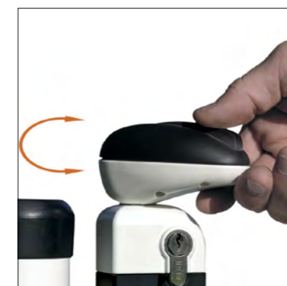
Portillon équipé d'un système d'ouverture nécessitant une double action