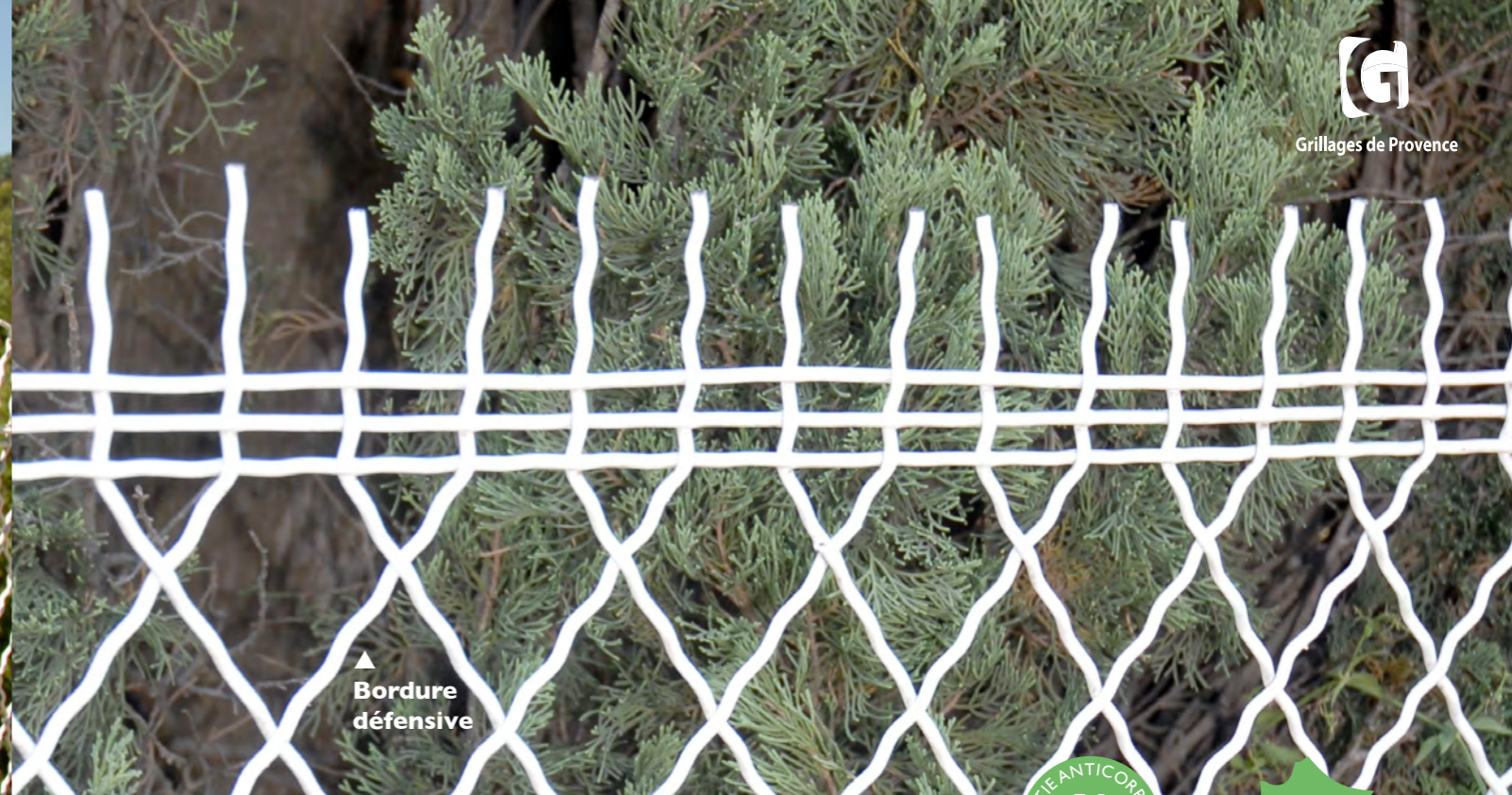
▲ Bordure défensive