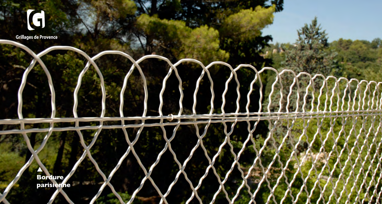
▲ Bordure parisienne